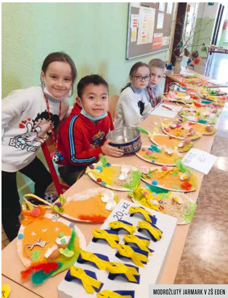
MODROŽLUTÝ JARMARK V ZŠ EDEN

S adaptací v novém školním prostředí pomáhají malým Ukrajincům i krajané z řad zaměstnanců a rodičů, kteří už v Česku žijí delší dobu. „Reagovali na výzvu ředitelů a nově přichozím primárně pomáhají překonávat jazykovou bariéru a komunikovat se školou. Někteří se zapojují i do dalších aktivit ve svém volném čase. Například přichozím předávají praktické informace o poby-