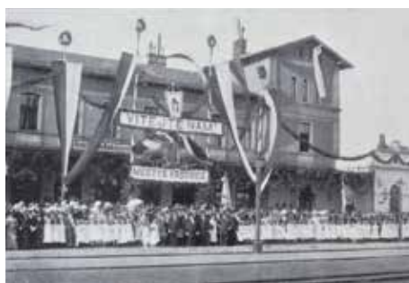
VÍTÁNÍ CÍSAŘE FRANTIŠKA JOSEFA I. NA NÁDRAŽÍ VE VRŠOVICÍCH