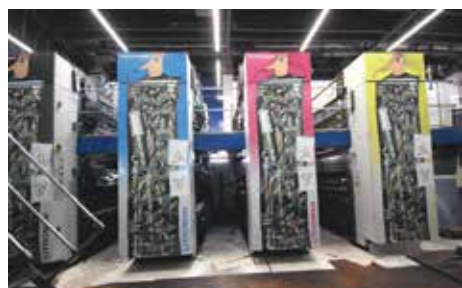
ROTAČKA, NA KTERÉ SE TISKNOU MAGAZÍNY JAKO PRAHA 10

V současnosti je tiskárna součástí mezinárodního holdingu EDS (u nás také Severotisk v Ústí nad Labem a Typos v Plzni), který se nedávno dostal do vlastnictví českého kapitálu. Svoboda Press je největším polygrafickým závodem v Česku, na pěti rotačních strojích se zde pracuje takřka v nepřetržitém provozu. Knihy už