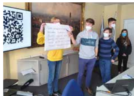
SETKÁNÍ S ŽÁKY NA RADNICI V RÁMCI ŠKOLNÍHO FÓRA

Projekt Moje stopa nastartoval užší spolupráci mezi městskou částí a aktivními učiteli, kteří na školách participativní rozpočet koordinovali. Spolupracovali přitom s žákovskými parlamenty, jejichž zástupce jsme na začátku března pozvali na představení projektu Školní fórum. Na radnici zavítalo 21 aktivních žáků a studentů od 5. třídy základních škol až po střední školy, kteří se chtějí podílet na rozvoji naší městské části. Z každé školy mohli přijít dva žáci nebo studenti, nejlépe ti, kteří tady také bydlí. „Naším cílem je vytvořit fungující skupinu školáků, kteří se budou pravidelně scházet a diskutovat své nápady. Zajímá nás,