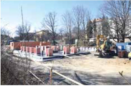
ROZESTAVĚNÁ MŠ BAJKALSKÁ

V letech 2020 a 2021 investovala radnice Prahy 10 do budov mateřských a základních škol celkem 211 milionů korun. Největší stavební akce v uplynulém období představovala rekonstrukce školky U Vršovického nádraží, která dostala i nové přístavby. Dokončila se rovněž přestavba objektu v Jasminové ulici a aktuálně vzniká novostavba školky v Bajkalské ulici, kam bude chodit až 168 dětí.