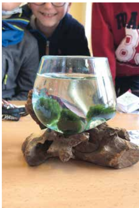
VÍTĚZEM MOJÍ STOPY VE ŠKOLE SE STALA I ŘASOKOULE (ZŠ EDEN)