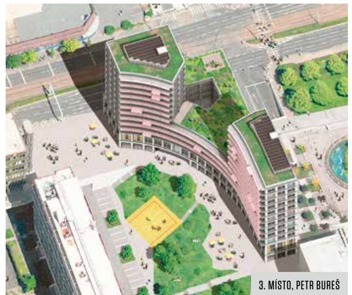
3. MÍSTO, PETR BUREŠ