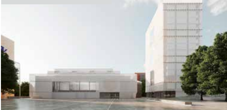
2. MÍSTO, MARTINEZ / MORERO / RECABARREN

Porota nakonec našla stoprocentní shodu na volbě vítězného návrhu. Podle jejího názoru respektuje polohu původního kulturního domu a jeho prostory využívá k vytvoření důmyslného konceptu. Víceúčelový sál je situován do podzemí mimo objemy městského bydlení a navenek se projevuje ve formování souvisejícího parteru. Soutěžní návrh na druhém místě důsledně zkoumal možnosti zachování stávajícího kulturního domu. Poukázal přitom na finanční i provozní náročnost takového řešení. Záměr je podpořen velkorysým urbanismem širokého záběru a obytnou budovou. Návrh, který se umístil jako třetí, prezentuje nadčasový přístup bez předsudků k retro výrazu padesátých let. Jeho základní kvalitou jsou varianty různých forem bydlení a porota ocenila i nečekané a funkční urbanistické uspořádání.